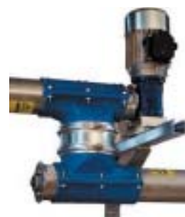
Sammankoppling två skruvar