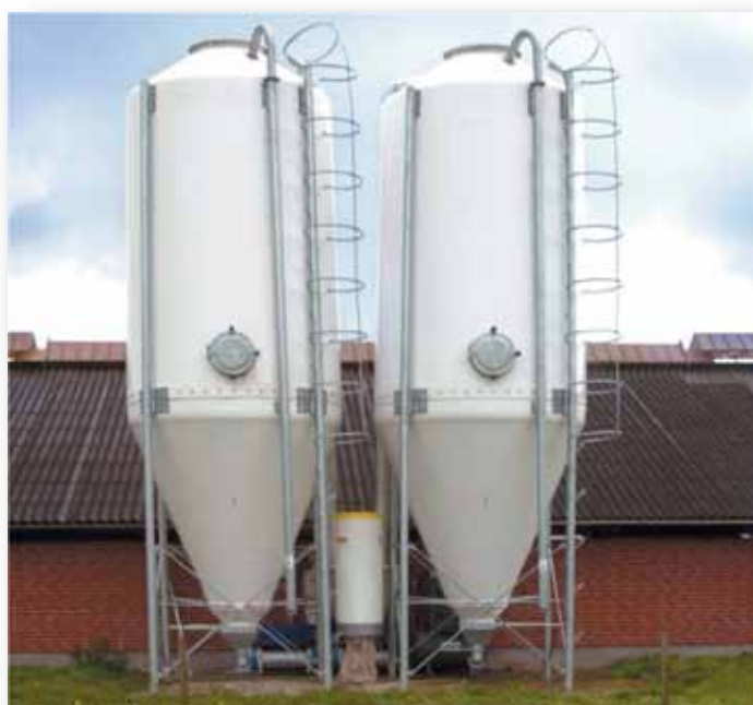
Dammsamlaren kan betjäna flera silor utan problem

För att säkerhetsställa komplett rengöring av filtret vid byte av plasticsäck så finns ett handtag monterat för att skaka ur filtret utan störande dammbildning. Uppsamlings säcken i plast är monterad med ett snäpplås och byts ut lätt vid behov.